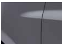
KASSZIOPEIA SZÜRKE (KNG)*